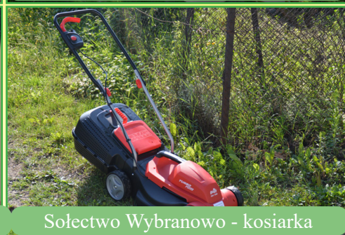
Sołectwo Wybranowo - kosiarka