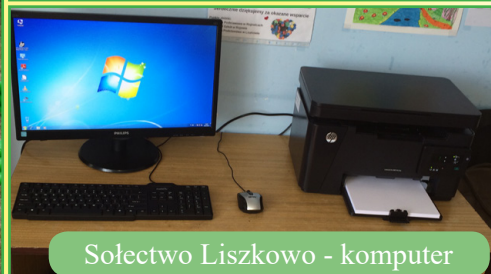
Sołectwo Liszkowo - komputer