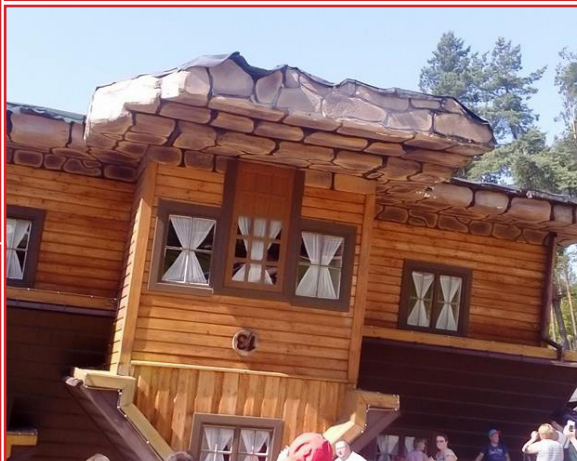
Wycieczka pań ze Stowarzyszenia str. 6