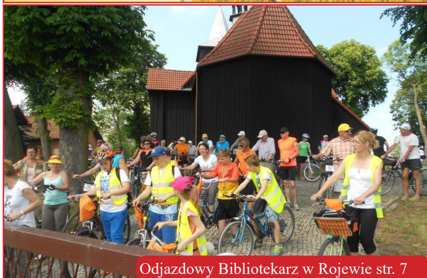
Odjazdowy Bibliotekarz w Rojewie str. 7