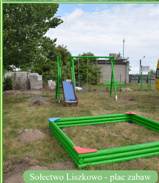
Sołectwo Liszkowo - plac zabaw