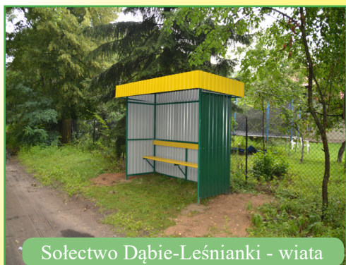
Sołectwo Dąbie-Leśnianki - wiata