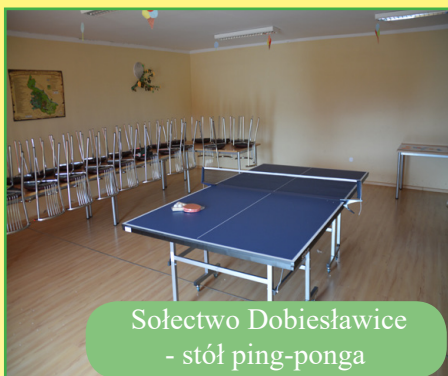
Sołectwo Dobiesławice - stół ping-ponga