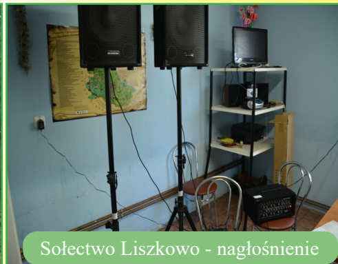
Sołectwo Liszkowo - nagłośnienie