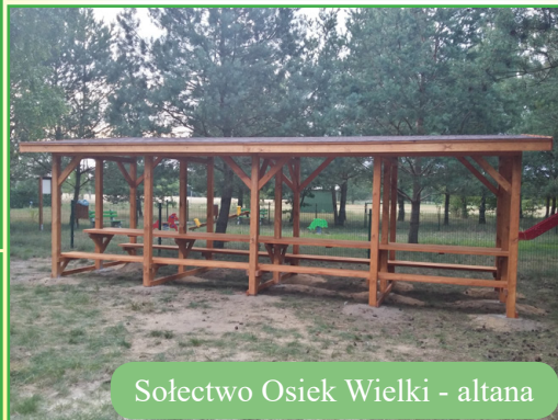
Sołectwo Osiek Wielki - altana