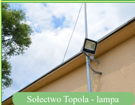
Sołectwo Topola - lampa