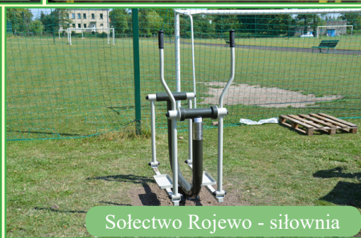
Sołectwo Rojewo - siłownia