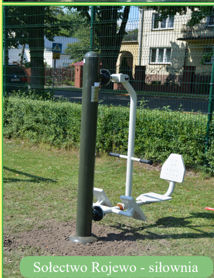
Sołectwo Rojewo - siłownia