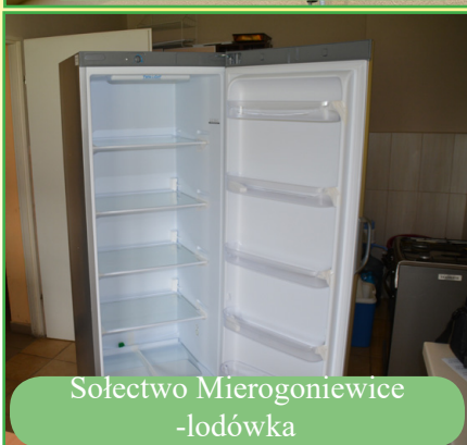
Sołectwo Mierogoniewice - lodówka