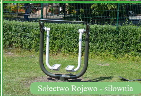
Sołectwo Rojewo - siłownia