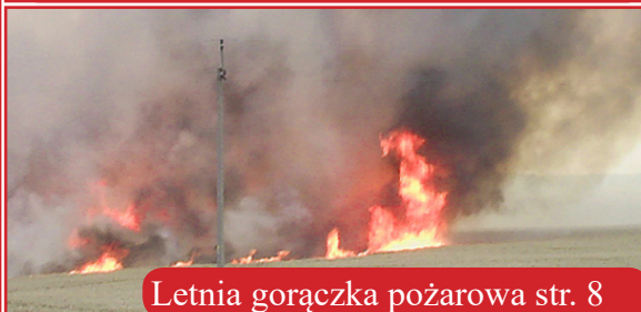
Letnia gorączka pożarowa str. 8