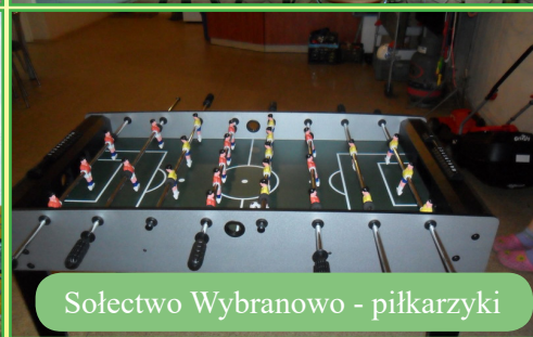
Sołectwo Wybranowo - piłkarzyki