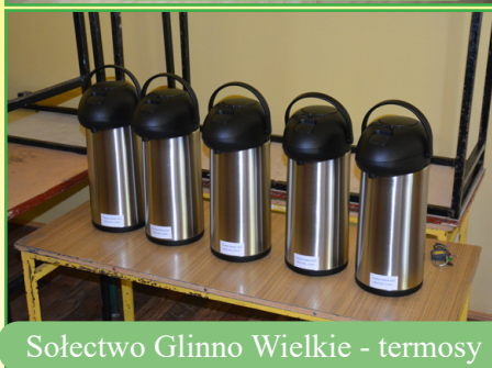
Sołectwo Glinno Wielkie - termosy