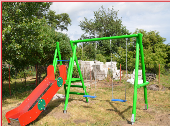
Realizacja Funduszu Sołeckiego... str. 4