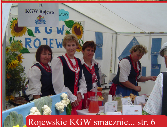
Rojewskie KGW smacznie... str. 6