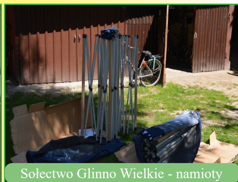
Sołectwo Glinno Wielkie - namioty