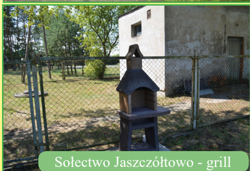
Sołectwo Jaszczółtowo - grill